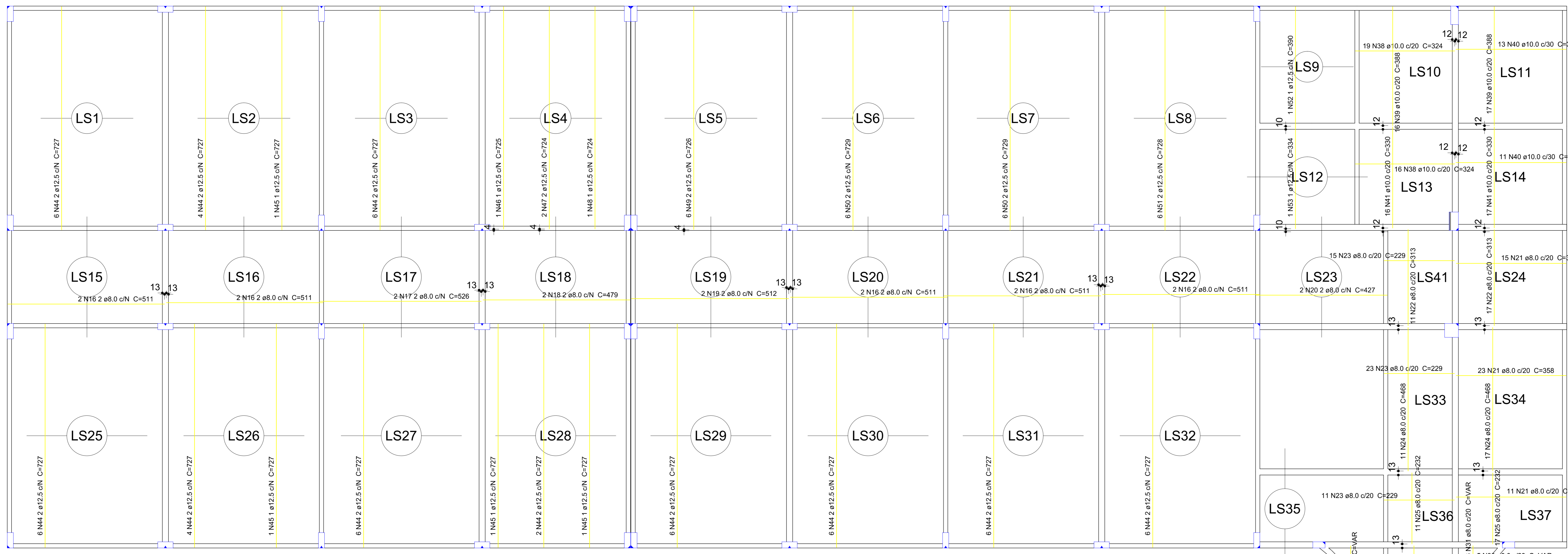
Armação positiva das lajes do pavimento SUPERIOR escala 1:75