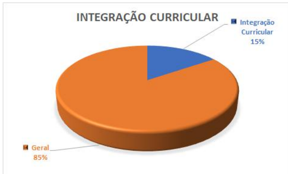
Fig.2: Representação gráfica da integração

A integração curricular, em especial, a intersecção entre os conteúdos da formação geral e da formação técnica, correspondem a componentes curriculares em sua totalidade ou parciais, conforme desenho de matriz curricular, corresponde a 520h o que corresponde a aproximadamente 15% da carga horária do curso. Não serão ofertadas atividades não presenciais.