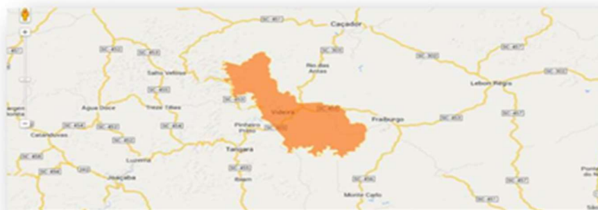
Figura 1. Videira e suas Fronteiras

Nesta regionalização na qual o IFC se encontra inserido, é oportuno destacar que Videira é um município em franca expansão econômica, fortemente alicerçada na sua consolidada identidade industrial.