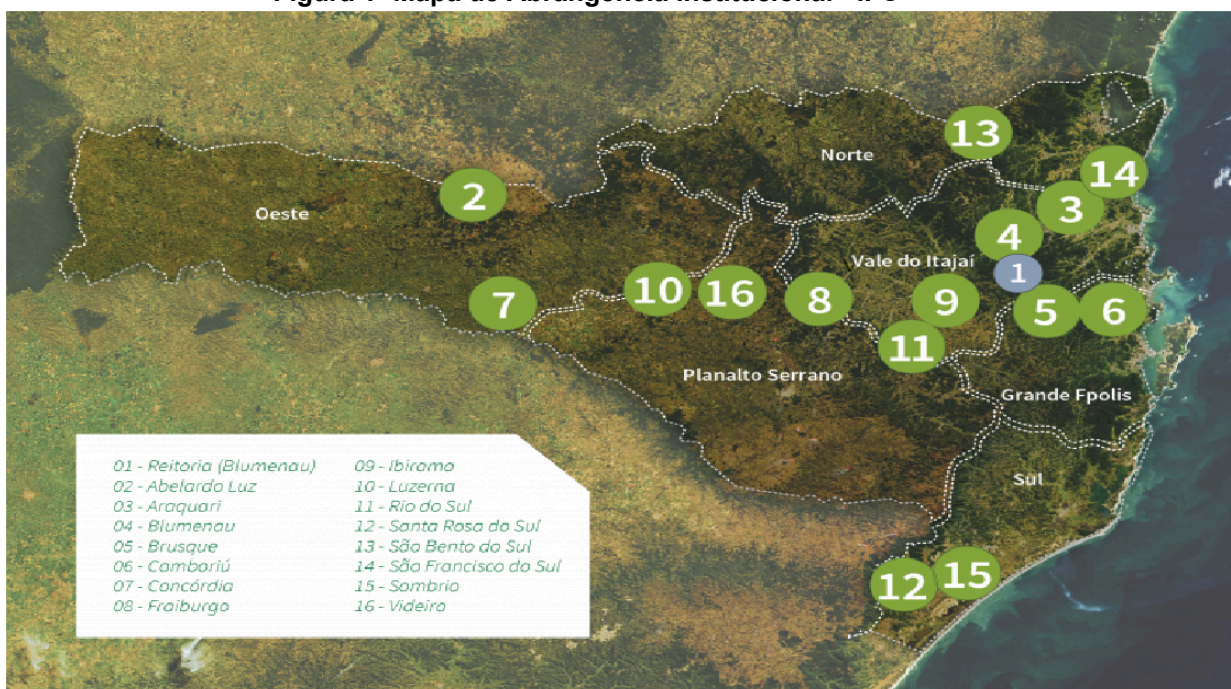
Figura 1- Mapa de Abrangência Institucional - IFC