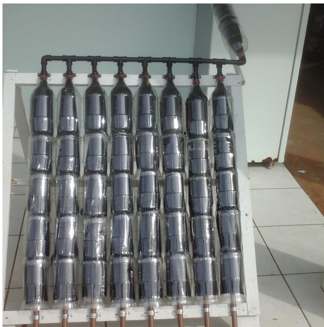
Figura 04 – Painel solar montado.

O sistema não funcionou muito bem, então resolvemos instalar um rotor, acionado por uma placa solar, infelizmente não registramos através de fotos, para que o fluxo de ar dentro do sistema fosse maior. Com isso conseguiu-se aumentar a temperatura dentro da estufa/geladeira. Antes de ser instalado a temperatura chegava a 30°/32°C após instalado o sistema rotor/placa solar, conseguimos alcançar temperaturas na faixa de 41°/42°C, o que melhorou o processo de secagem das plantas.