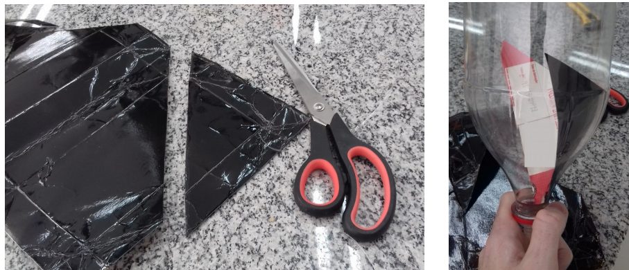
Figura 03 – Corte triangular feito nas embalagens Tetra Pak para a ponta dos tubos.

A estrutura do painel foi feita com quatro ripas de madeira, com 1 m de comprimento. Para o suporte, cortou-se mais três ripas com 1 m. Os tubos foram fixados no suporte com abraçadeiras.