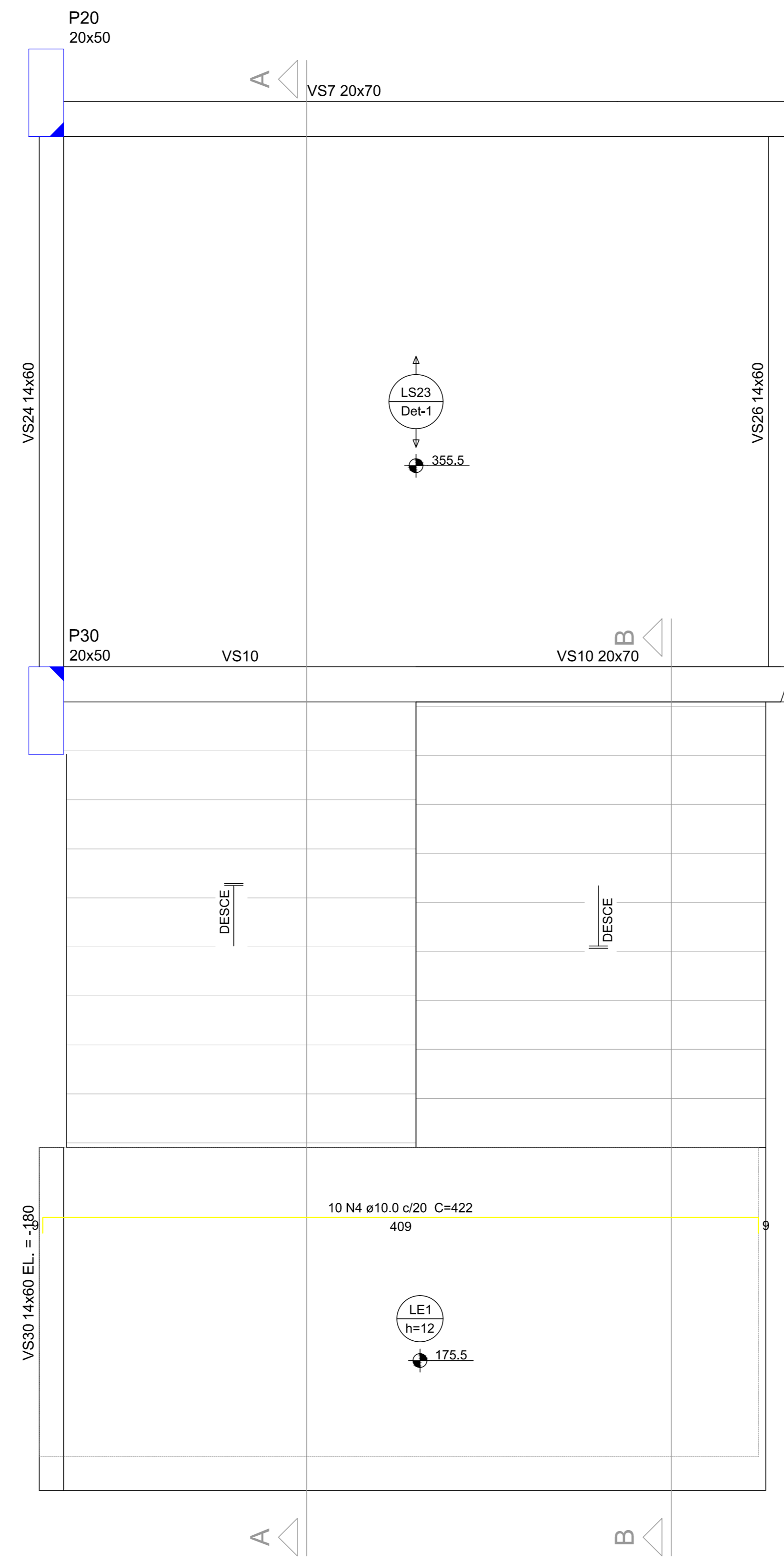
Armação negativa da escada E1 escala 1:25