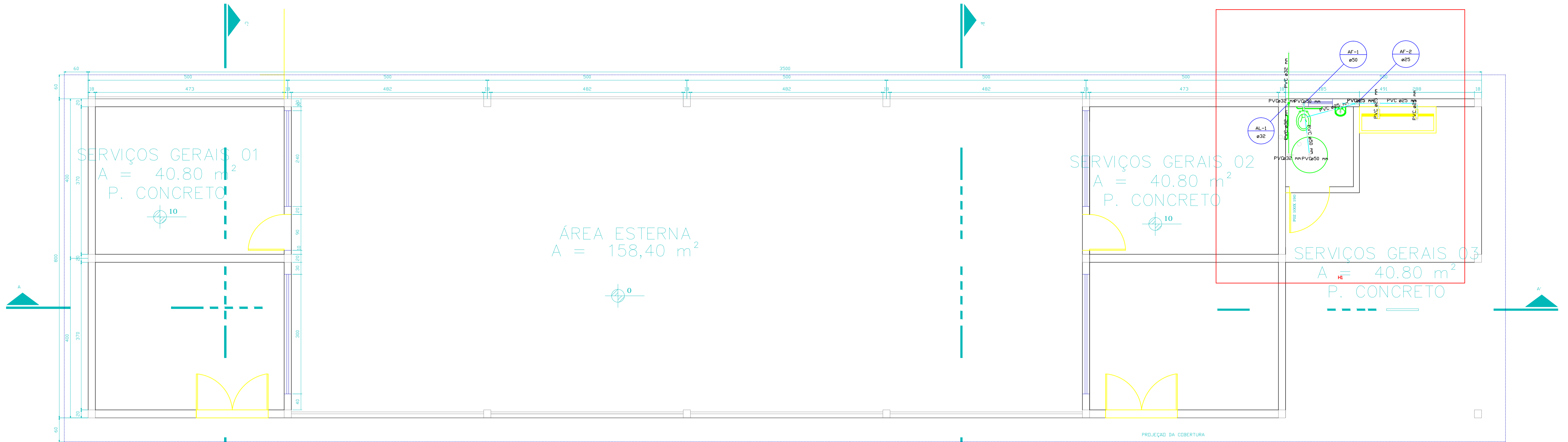
PLANTA BAIXA ÁGUA FRIA ESCALA 1:50