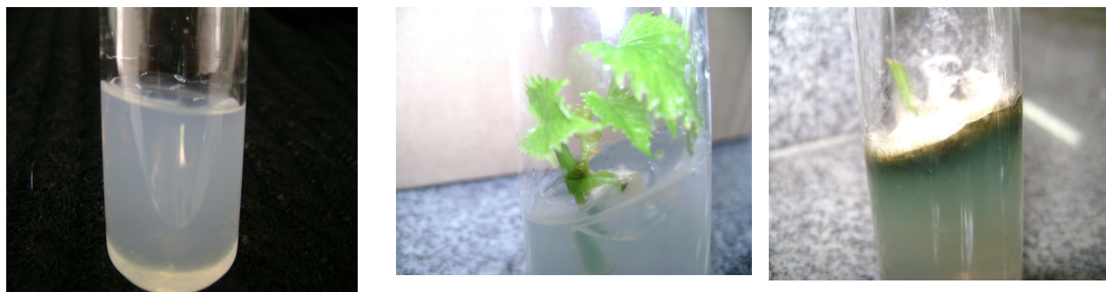
Figura 1. Exemplos de meio de cultura MS implantados ou não com explantes do porta enxerto Paulsen 1103, destacando a proliferação de micro-organismos em C.

(A) Meio de cultura excedente (B) Meio de cultura com (C) Meio de cultura com utilizado no experimento explante em crescimento no grande proliferação de como testemunha. meio de cultura, com micro-organismos, o pequeno foco de explante não se contaminação. desenvolveu.