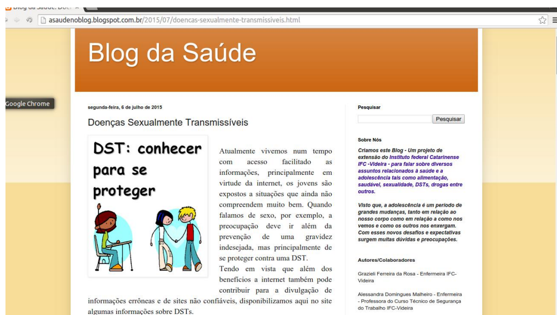
FIGURA 01- Captura de tela do Blog

O projeto de extensão Blog da Saúde alcançou os objetivos propostos, pois foi desenvolvido para tratar de temas relevantes na área da saúde, promovendo discussões sobre hábitos de vida saudáveis e qualidade de vida, além disto, houve envolvimento da comunidade escolar e público externo, já que os temas trabalhados eram sugeridos pelas pessoas que acessavam o blog, bem como pelas que deixavam suas perguntas e sugestões na caixa de sugestões que encontrava-se na escola. Contabilizamos mais de 1.300 acessos no decorrer deste período.