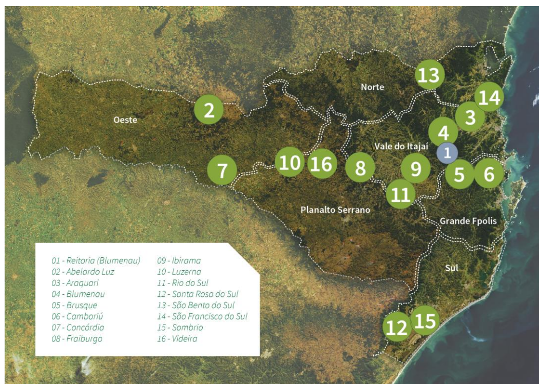
Figura 1 – Mapa de Abrangência Institucional – IFC.